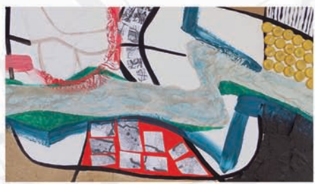
Пространство ( Space )