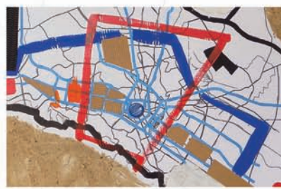
Урбанизам ( Urbanism )