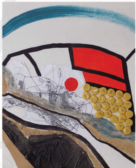
Градско јадро ( City core )