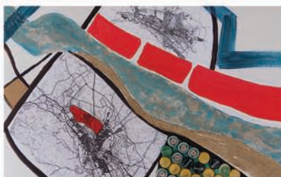
Зона ( Zone )