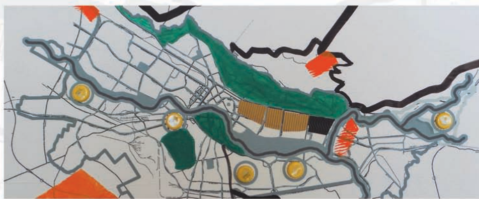
Линеарен развој ( Linear development )